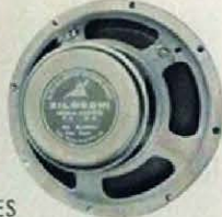
ALTO FALANTES 6" e 6x9"