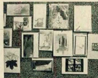
Cartões-lembrança do Emcomum .

Os cartões — tamanho médio de 13 x 18 cm — podem ser pedidos ao grupo Emcomum pela caixa postal 58079, São Paulo, ou pelos telefones 883-0371 (Ro-