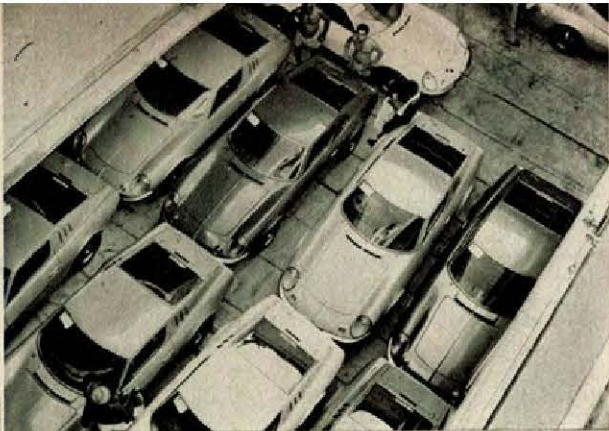
O primeiro lote de vinte Puma exportados já está na Suíça.